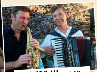
Wolf & Wagner